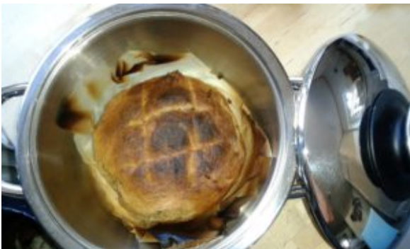
Dinkelbrot im Topf 1

Dinkelbrot im Topf backen! Dies geht allerdings nur in einem AMC-Topf (20 cm Durchmesser) und dem Navigenio von AMC – Als Einheit ist dies der kleinste Backofen der Welt!