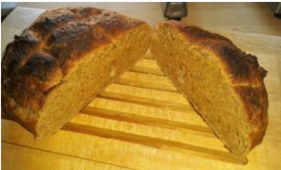
Dinkelbrot im Topf 3