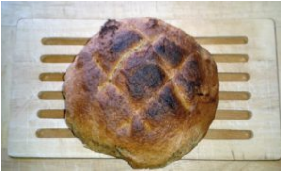
Dinkelbrot im Topf 2