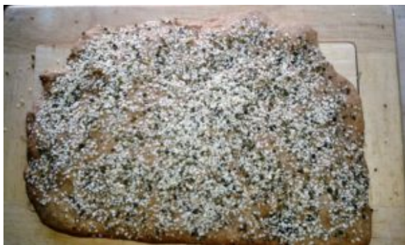
Fladenbrot mit Weintrauben 1